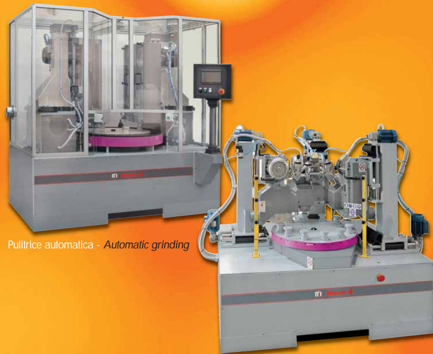
Pulitrice automatica - Automatic grinding