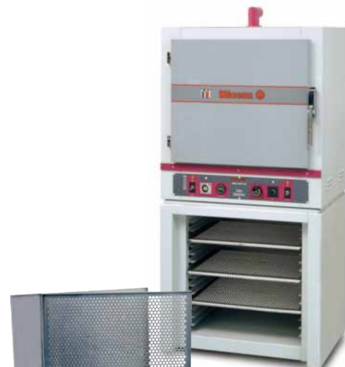
FOS 200 + MP 200

The enamel dispenser DIS can be fitted with a wide range of syringes (10-30-60 cc) connectors, joints and needles (from 0,5 to 1,6 mm diameter) for the various applications. The piece of equipment is completed with 3 enamelling paddles: inclined, straight and L shaped.